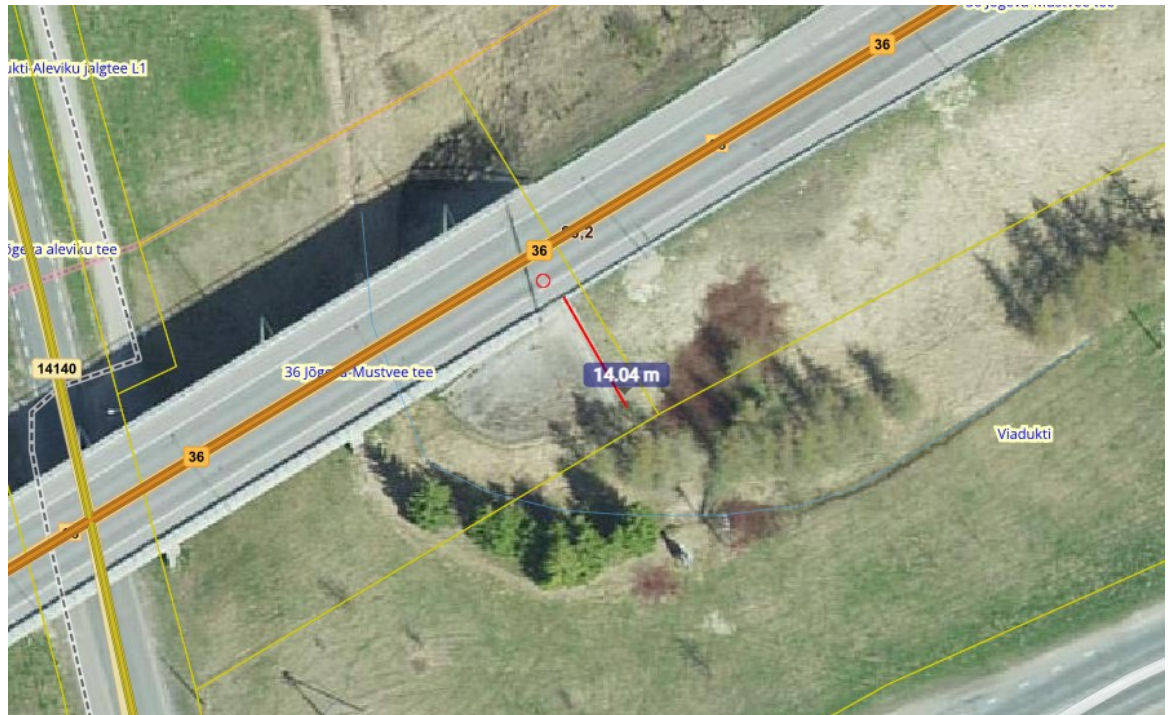
Joonis nr 2. Väljavõte maa-ameti kaardilt. Viadukti muldkeha ulatub 14 m kaugusele.